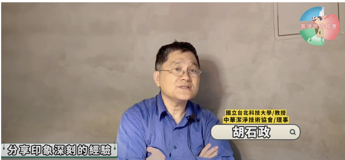
胡石政 | 現任 國立台北科技大學特聘教授

科技的變化與進步非常快，因此，康博也建議各界人才可投入研發【自動感測技術】，藉由更微量更精密的控制系統自動偵測環境，能夠有效檢測出半導體製程的污染物與發生源，進而不斷提高製程良率，自然能夠提高產業競爭力與核心價值。由協會這個第三方單位，來串連國際不同國家的潔淨協會，進而讓各國看見台灣的科技實力與無限的潛力！